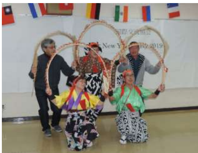
（飛び入り参加も交え・・・、 「世田谷招福一座」さんによる南京玉すだれ）