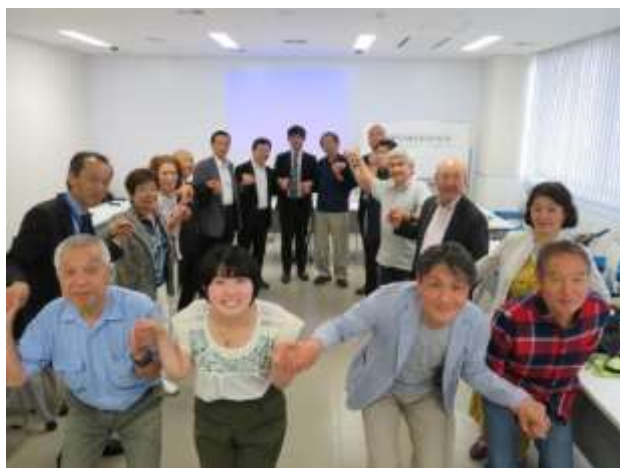
(前回の総会後の記念撮影)

尚、総会の終了後は、記念撮影をしたり、参加者でフリーディスカッションを行う簡単な交流会も予定しています。KIFAの活動内容を知りたい方、他の会員と知り合いたい方、意見交換をしたい方なども、是非、お気軽にご来場ください。