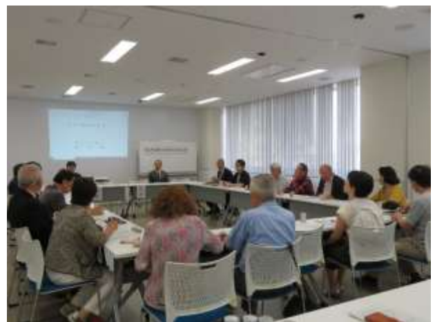
(前回の総会の様子)