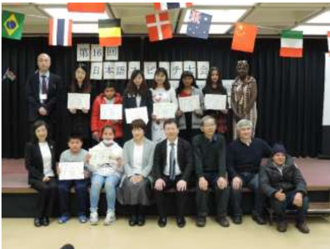
(表彰後の記念撮影)

終了後は交流会を開き、来場の方々ともコミュニケーションの場を持ちました。また、警視庁の方による外国人の方向けの防犯のお話もあり、有意義な時間を過ごすことができました。