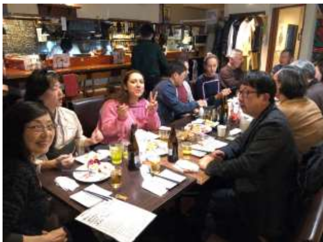
(2019年1月5日の新年会の様子)

年始1月5日の「こまぐりっしゅ cafe」では、お店（ゴータバー）さんのご厚意で、新年会も行いました。飛び入りの外国人も交えて、楽しい時間を過ごしました。