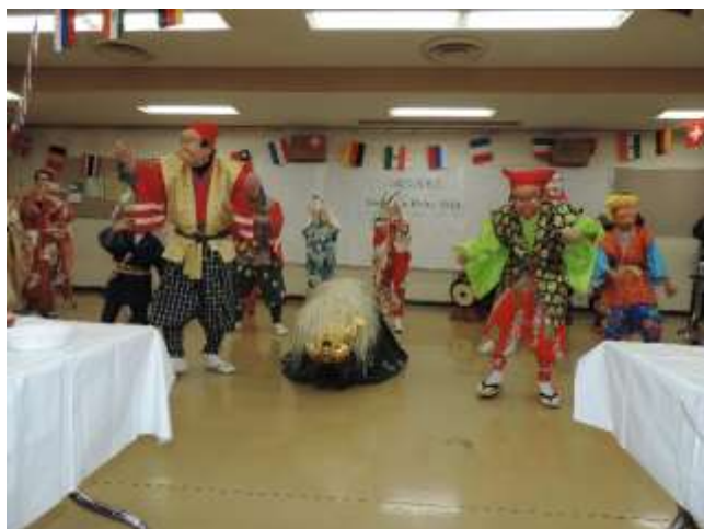
（「小足立ばやし保存会」さんによる獅子舞の演舞）

1月27日（日）、恒例の「New Year Party」を開催しました。今回の出し物は、新春の催しにちなんだ獅子舞・南京玉すだれ・日本舞踊の三重奏という構成でした。