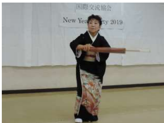
（演歌でも有名な、『雪国～駒子 その愛』 「美重駒会」さん）

今回も 10 名を超える外国人の方々に着物を着ていただき、華やかなムードの中で催しを楽しんでいただきました。