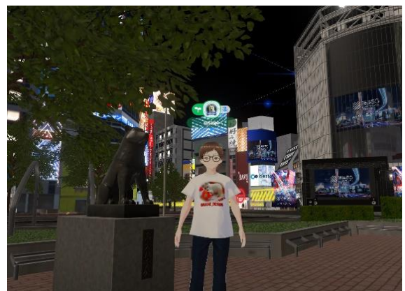
(VR オリジナルTシャツを作りました)

現実でも多摩川散歩、サイクリング、多摩水道橋下でSUP（スタンドアップパドルボード）を楽しんでいます。