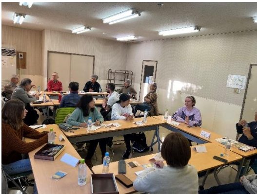
昨年12月の様子（駄倉地域センター）