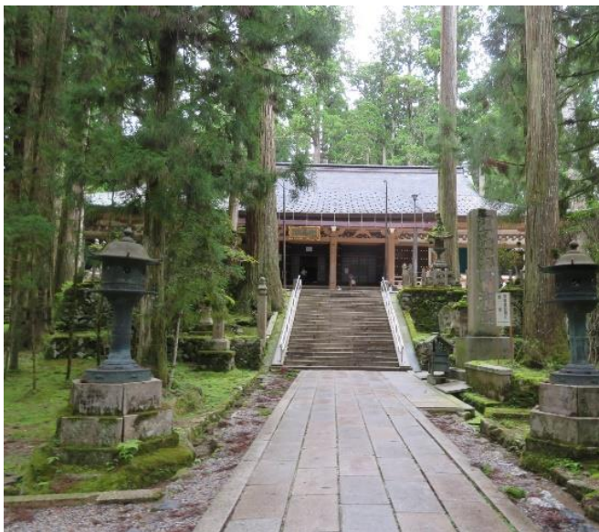
高野山の奥之院、静かな心洗われる場所です。

今年度のKIFAの活動は、コロナ前の状況に戻っています。皆様には、お楽しみいただけていますでしょうか？個人的には、より多くの外国の方々と交流ができればいいなと思っています。狛江市の外国の方々をサポートする他の団体との交流を深め、より楽しいKIFA活動になるように心がけたいと思っています。皆様のご理解とご協力を、よろしくお願いいたします。